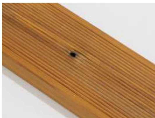
Malá díra po suku (ne skrz) na desce je povolena.