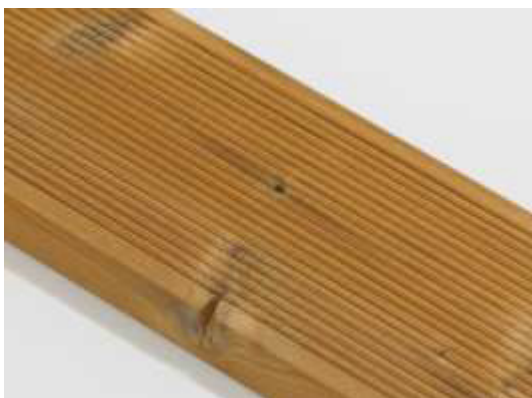
Malá prasklina suku na hraně je povolena.