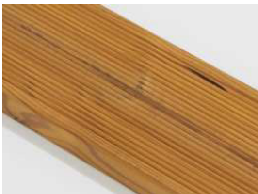
Smolníky jsou povoleny.