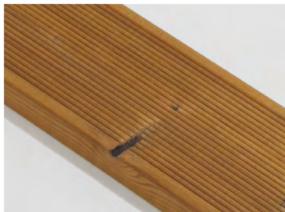
Malý chybějící suk je povolen.