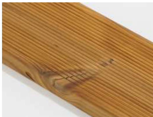
Jednoduchá prasklina suku je povolena.