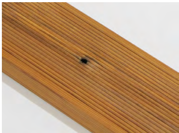
Malá díra po suku (ne skrz) na desce je povolena.