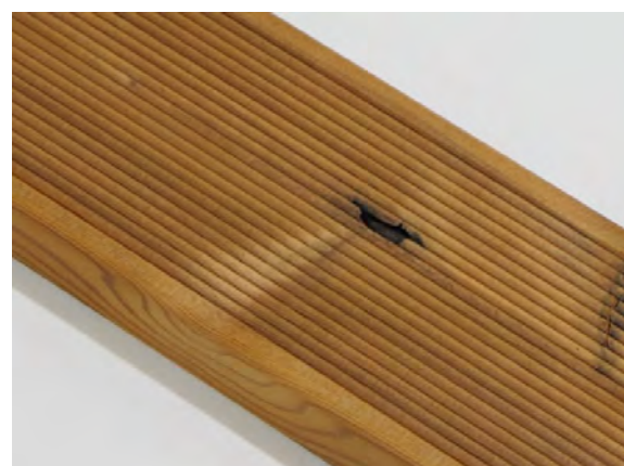
Malé viditelné vady jsou povoleny.