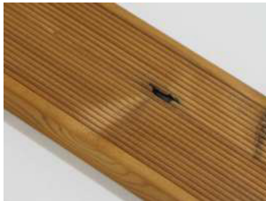
Malé viditelné vady jsou povoleny.