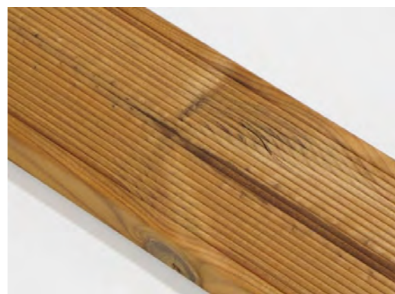
Malé podélné trhliny na povrchu jsou povoleny.

Rozměrové tolerance vad jsou specifikovány v samostatném dokumentu „Standardy dodávek pro exteriérové profily ThermoWood® (materiál - borovice lesní, úprava Thermo-D). Kritéria kvality třídy materiálu „ThermoWood® A“.