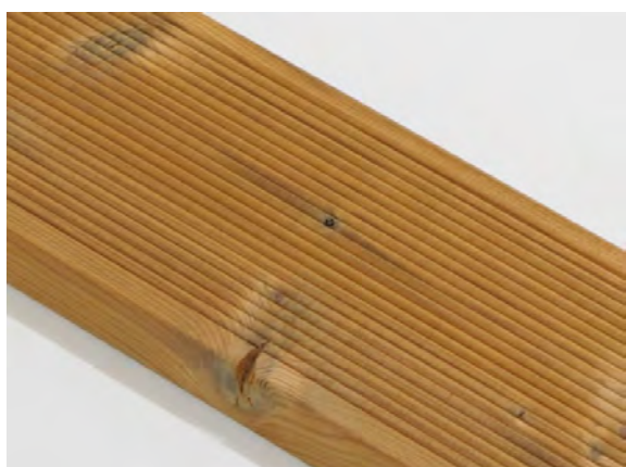
Malá prasklina suku na hraně je povolena.