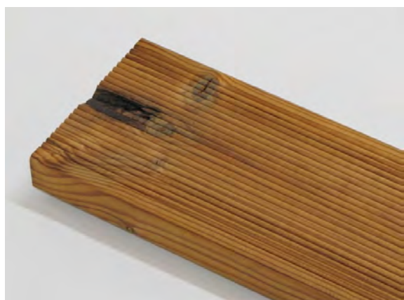
Obecně 8 cm od konců desek není tříděno.