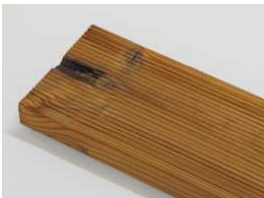
Obecně 8 cm od konců desek není tříděno.