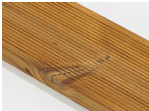
Jednoduchá prasklina suku je povolena.