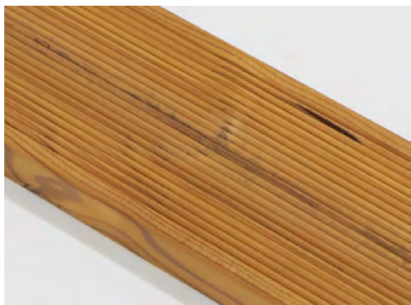
Smolníky jsou povoleny.